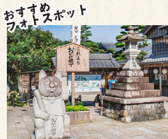
おすすめスポット