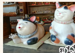
おすすめスポット