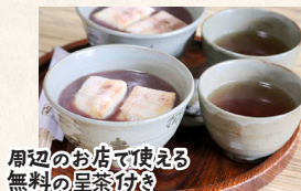
周辺のお店で使える無料の呈茶付き