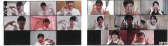
〈食品業界理解ワークショップ〉※オンライン開催の様子

参加企業)アサヒビール、カゴメ、キューピー、 ハウス食品、森永乳業、成城石井など 約20社参加