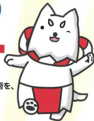
磐田市イメージキャラクター ひっぺい

企業間のビジネスマッチングの場である「産業振興フェア in いわた」を今年も学生を対象に1日開放します!! 当日は、企業 約100社が参加!! モノづくりの街、磐田の企業のイチオシの製品や技術を、ぜひこの機会に自分の目で見ていただき、企業情報収集の場としてご利用ください。