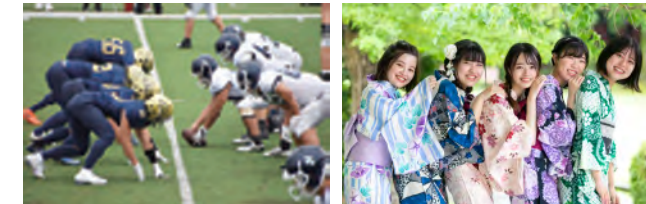
アメリカンフットボール

本学では、課外活動を「正課を補充する、教育の一環」として位置づけ、学生の皆さんが、積極的に課外活動に参加することを推奨しています。学部も学年も異なる仲間と一緒に汗を流したり、ひとつのものを創り上げたり、そんな貴重な体験ができる課外活動は一生の思い出になります。課外活動を通じて学び成長したことは、今後の人生にも役立ちます。