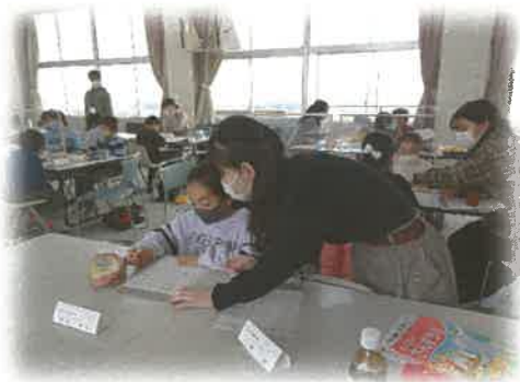
《わくわく算数教室 片葩小》