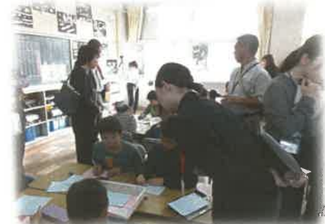
《算数科の研究授業参観》

■情報交換会やワークショップ、授業参観、研究協議、講演会等があり、教員をめざす皆さんの学びがどんどん広がります。活動内容を発表する機会もあり、町内で活動する多くのSPと情報交換ができるのもこの研修会の魅力のひとつです。また、毎回、町長、教育長、町議会議員、教育委員の皆さん、関係大学の先生方、SPのOBの先生方など様々な立場の方に参加いただき、教育活動について有意義な学びの機会となっています。