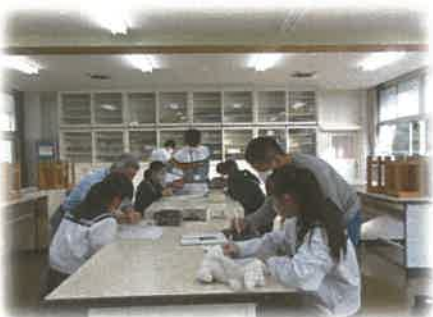
《自主学習会での支援》

■教員をめざす学生の皆さんにとって、子どもたちとの感動体験や、年間を通して、現場感覚を味わえる開かれた学びの場となっています。