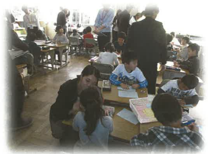
《算数の研究授業への参加・支援》

学校現場で体験したことや子どもたちに寄り添った様々な活動は貴重な体験の場、学びの機会です。教職をめざす皆さんの多様なニーズに応えられる学生ボランティア活動になるよう町全体で取り組んでいます。