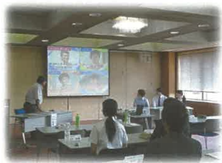
《SP経験教師を交えたパネルディスカッション》

町内登録のSPの皆さんや学生ボランティア活動に関心のある大学生の皆さんなどを対象に町SP研修会を開催しています。