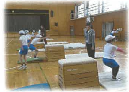
《体育科の授業での支援》