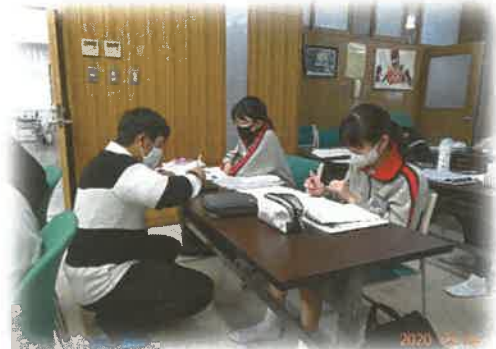
《わくわく数学教室 東浦中》