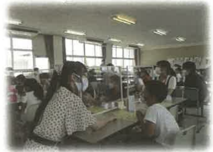
《わくわく算数教室》

■片葩小(モデル校)が活動の柱のひとつとして取り組んでいます。令和2年度の「わくわく算数数学教室」は、コロナ禍の影響もあり、開催が危ぶまれましたが、感染予防対策をしっかり行っただけで、片葩小学校では、夏休みの土・日曜日(8/22, 23, 29, 30)の4日間の日程で開催しました。同じく東浦中では2日間(8/22, 29)のみでしたが無事に行うことができました。また、冬休みは、片葩小で5日間(12/24, 25, 26, 28, 1/4)の日程で開催しました。