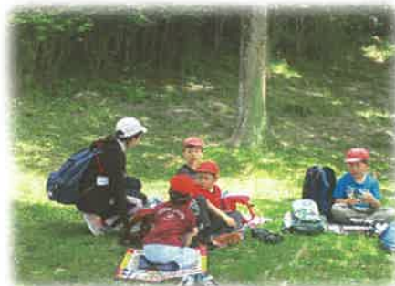
《校外学習での支援》