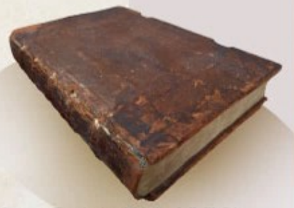
Summa Theologica Moralis, I, II, III, IV (アントニヌス『倫理神学大全』1477年)

Statuū multiplicitas. ibi. circūdata varie. Q uod ad primum. S. i. Ecclesia sc̄a regina dīci p̄t. rōne despōsatiōnis. q̄ xp̄o despōsata ē. q̄ ut h̄r Apoc. xiv. c. Est rex regū q̄ dñs dñan. et. ij Cor. xj. inquit aplūs. Despōdi vos. s. fideles om̄es qui sunt ipsa ecclesia. virginē castā exhibere xp̄o. I dec teus pmiserat p̄ osce p̄pham. ij. c. dicēs. D espōsabo te mihi i fide. R egina etiā dī ecclesia rōne p̄missionis. q̄ sibi p̄mittit̄ regnū celoz sc̄z cūctis vere fidelibz I diero. ad rusticū. N ihil felicius cristiano cui p̄mittit̄ regnuz celozum E n̄ ipse rex dominus noster I hs xp̄c bicturus est fidelibz suis. E tenit̄ b̄ndicti patris mei p̄cipite regnū vob̄ patū M ath. xxv. D ī etiam ecclesia regina rōne recte sue gu