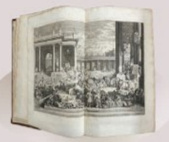
『Cyclopædia, or an Universal Dictionary of arts and sciences (チエンパーズ百科事典)』 1728年