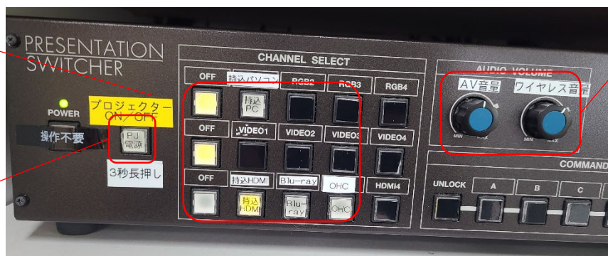
コントロール機器