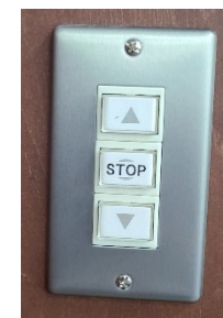
スクリーン昇降ボタン