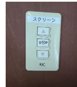
スクリーン昇降ボタン