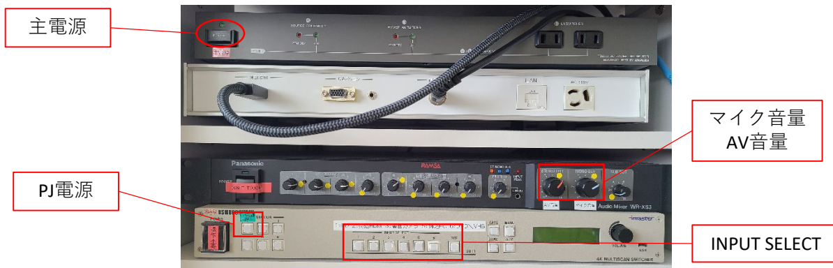
コントロール機器