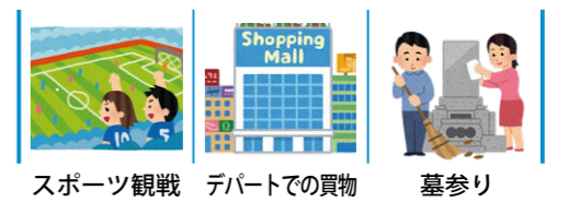
余暇活動等の社会参加のための外出の例