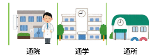
社会生活上必要不可欠な外出の例

社会生活上必要不可欠な外出と余暇活動等の社会参加のための外出が対象となります。これは「障害者の日常生活及び社会生活を総合的に支援するための法律（障害者総合支援法）」にもとづく地域生活支援事業の一つで、障害のある方の社会参加を可能にし、地域で自立した生活を送ることができるようにすることを目的としています。